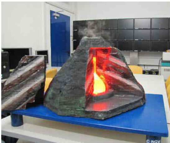
Modello di un vulcano

Presso lo stand INGV, nell'edificio 19 dell'Università di Palermo, è stata predisposta un'area scientifica dove gli esperti hanno presentato le attività dell'Ente, illustrando i metodi di sorveglianza sismica e vulcanica in Italia e le possibilità di applicazione della ricerca scientifica e tecnologica allo studio di vulcani, terremoti e ambiente. Adulti e bambini hanno potuto osservare rocce e modelli di vulcani, con simulazioni di processi di degassamento della camera magmatica, un sismografo durante l'attività di monitoraggio sismico e uno degli osservatori di nuova generazione per il monitoraggio ambientale sottomarino, con proiezioni di materiale audio-visivo per mostrarne il funzionamento e le fasi di deposizione.