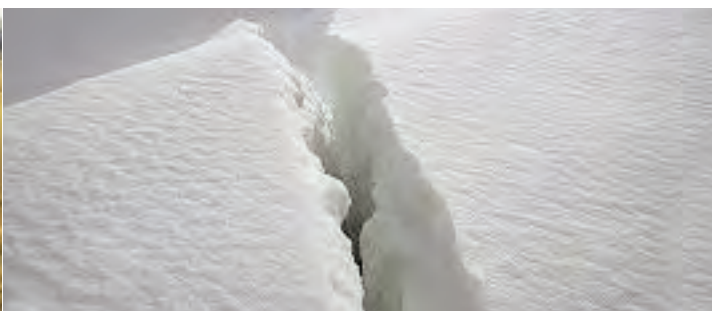
Immagini di faglie