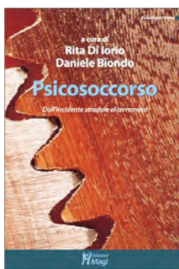
Una panoramica degli interventi di psicosoccorso