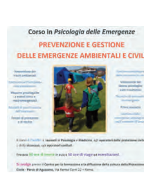
Sono aperte le iscrizioni alla Terza Edizione http://www.centrorampi.it/