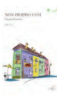
Il racconto di Sonia Topazio selezionato per l'antologia