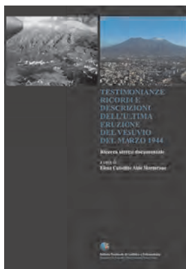
Il dvd dell'INGV sull'eruzione del Vesuvio del 1944