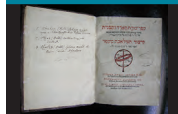
L'INGV ha finanziato il restauro del libro Abraham: bar Hijya . Un libro sulla Sfera Terrestre del 1546. Biblioteca Angelica-INGV